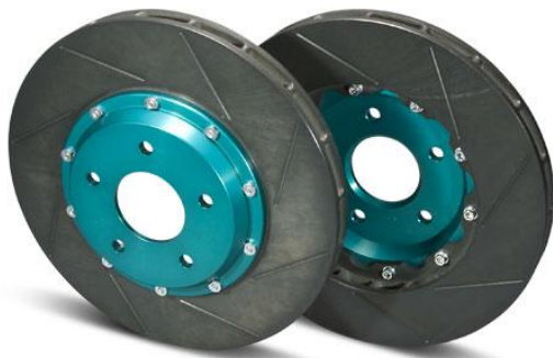
【画像はイメージです】

【品番】:GPRT012 (注 1)(注 2) <定価> ¥81,000(本体価格 ¥75,000)